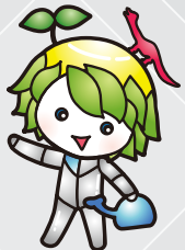
マスコットキャラクター