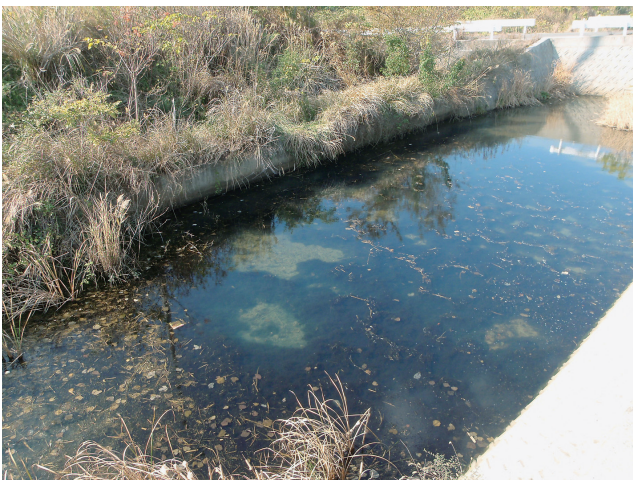
図2 イバラオオイシソウの生育地（今治市伯方島，2011年12月14日）