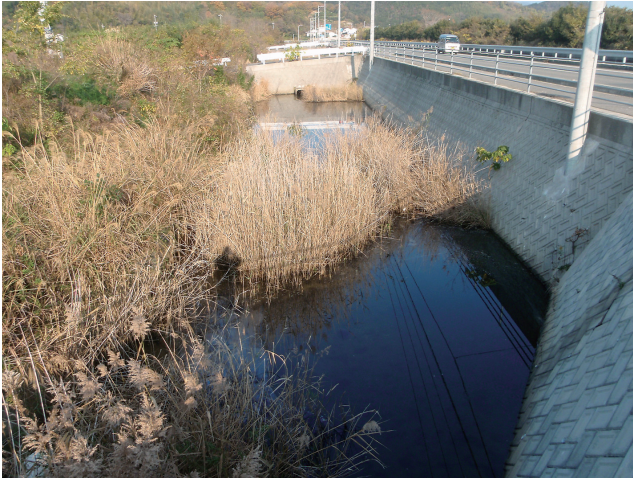
図1 イバラオオイシソウの生育地（今治市伯方島，2011年12月14日）

Vis.M.L.,Sheath R.G. and Cole K.M.(1992) : Systematics of the freshwater red algae family Compsopogonaceae in North America. Phycologia .31,564-575.