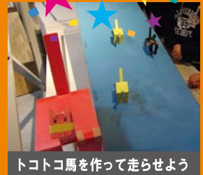
トコトコ馬を作って走らせよう

平成24年5月3日(木祝)・4日(金祝)・5日(土祝) 開館時間 9:00～18:30