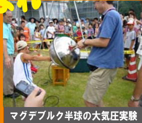
マグデブルク半球の大気圧実験